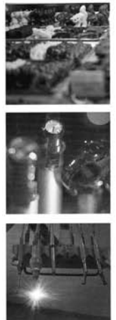
Choklad, exklusiva klockor och sträng banksäkerhets - allt detta finns kvar i Schweiz. Men makten vill öppna landet för nya möjligheter.

Berita Fyris berita.fyris@hi-tech-center.ch Jan Larsson jan.larsson@hi-tech-center.ch Urs Kammermann kammermann@unil.ch Daria Lindman daria.lindman@swissair.ch